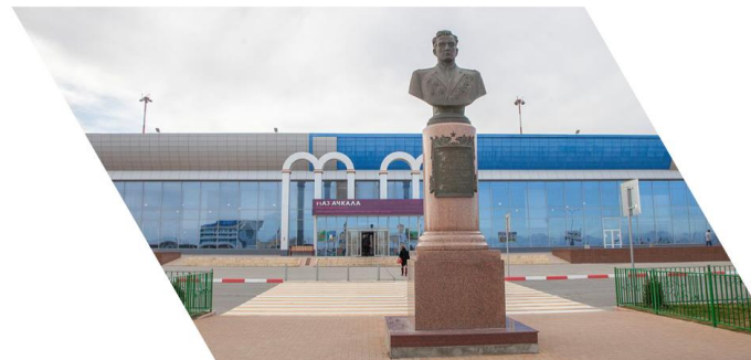
Международный аэропорт Махачкала (Уйташ) имени дважды Героя Советского Союза Амет-Хана Султана