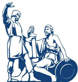
Общественная палата Российской Федерации CIVIC CHAMBER OF THE RUSSIAN FEDERATION

Общественная палата Российской Федерации