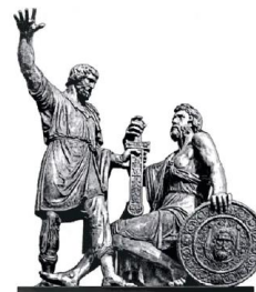
РОССИЙСКОЕ ИСТОРИЧЕСКОЕ ОБЩЕСТВО