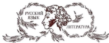
ОБЩЕСТВО РУССКОЙ СЛОВЕСНОСТИ